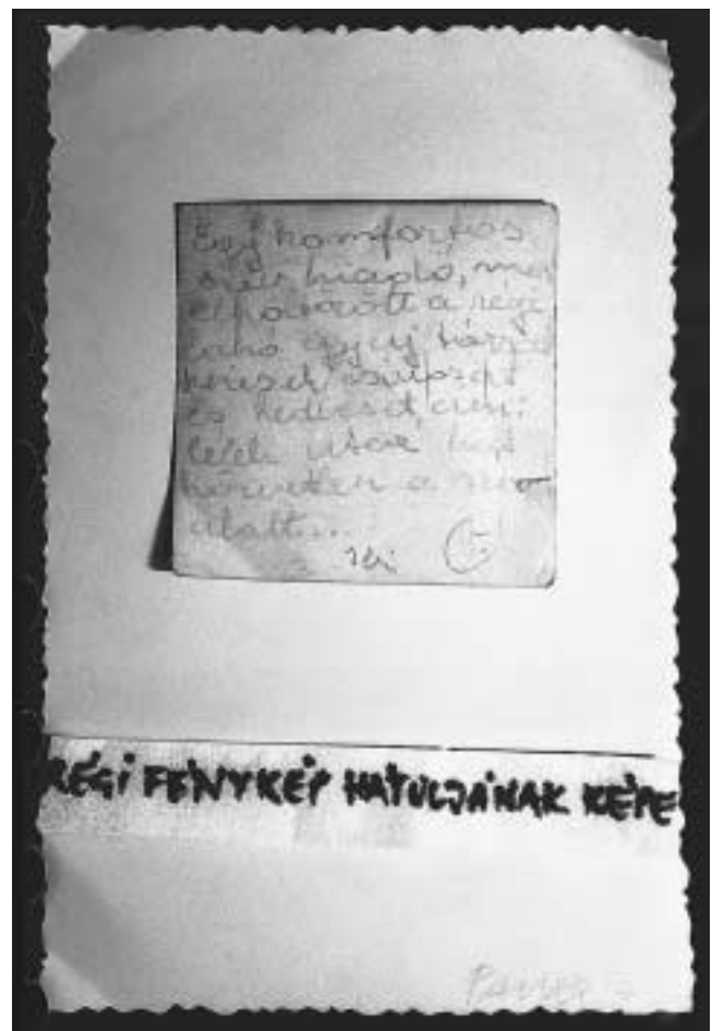
101–103. oldalon: Doboz, benne 10 fénykép , 1976 (Szjsz160) és „A nap sötétben van” , 1976 (Szjsz161)